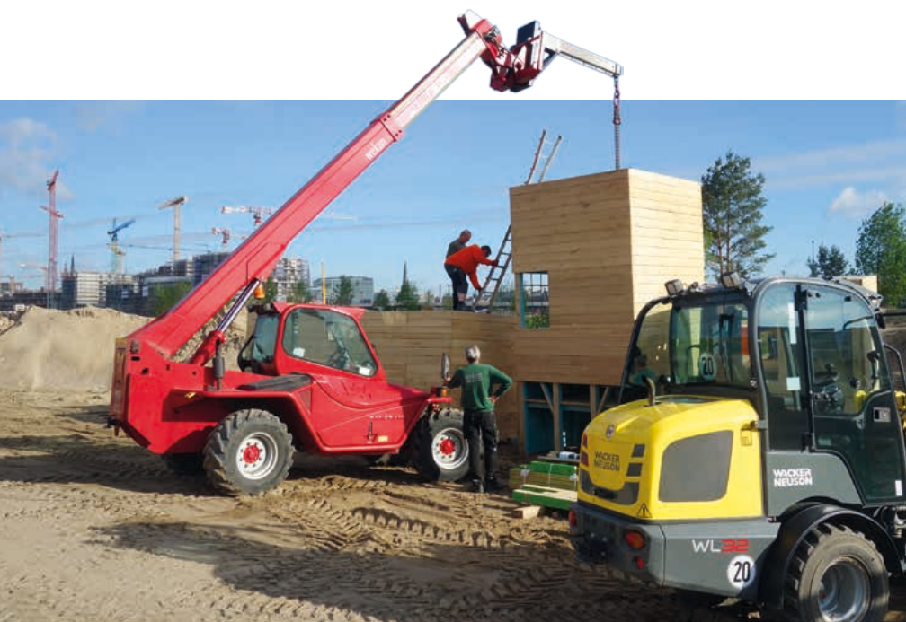
Ein Unikat findet seinen Platz. Für den Aufbau werden deutschlandweit Mietmaschinen benötigt.